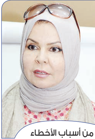
من أسباب الأخطاء في كتابة الهمزة وسائل الإعلام وضعف القائمين على تدريس اللغة العربية

وتحدثت عن الهمزة حينما تكون في الوسط والحركات التي تجعلها مرسومة على الواو أو الياء أو مرسومة على السطر، وكذلك حينما تكون متطرفة، وأشارت إلى بعض الأخطاء الشائعة في كتابة ورسم الهمزة وطريقة تلافيها.