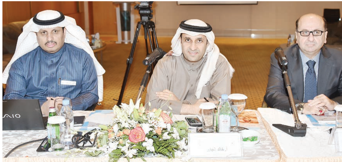
الجابر يدير الجلسة السادسة